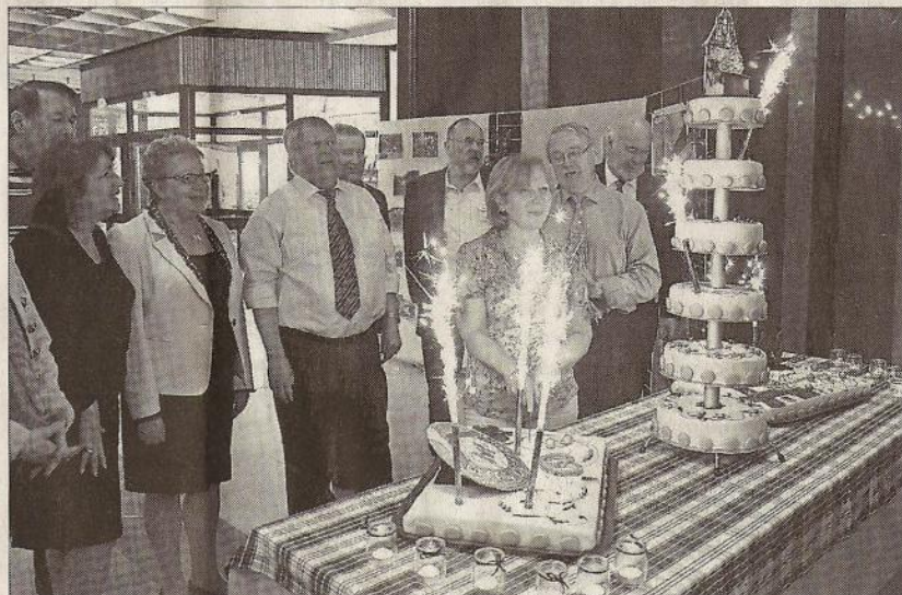
Le Relais départemental du tourisme rural, tout feu tout flamme pour ses 40 ans, avec l'Asma !